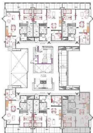
Ubicación apartamento tipo 01

Pisos 9 al 12 - 14 al 27 Área: 66.70 m 2