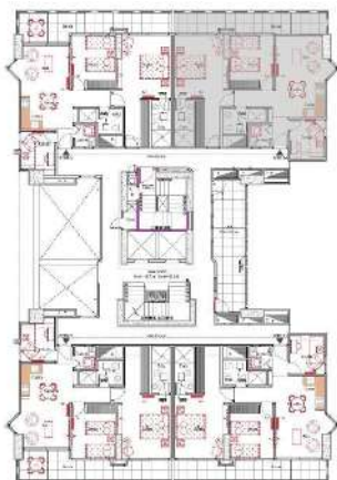
Ubicación apartamento tipo 104