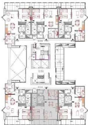
Ubicación apartamento tipo 02 Planta general

Pisos 9 al 12 - 14 al 27 Área: 66.30 m 2