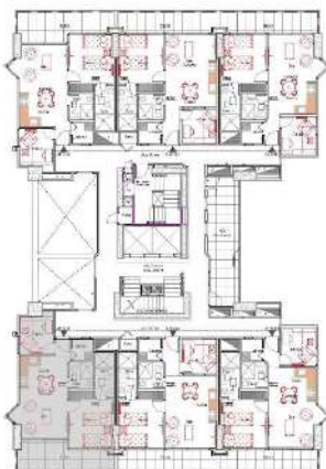
Ubicación apartamento tipo 03

Pisos 9 al 12 - 14 al 27 Área: 69.35 m 2