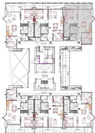
Ubicación apartamento tipo 06 Planta general

Pisos 9 al 12 - 14 al 27 Área: 66.70 m 2